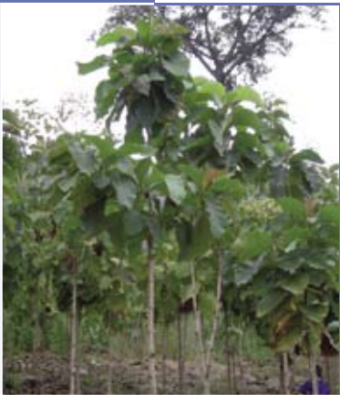
Teakbaumaufforstung Teak tree reforestation Reboisement de tecks

DIE VEREINIGUNG Case Togo Amis de la Nature ist seit September 2008 assoziiertes Mitglied der Naturfreunde Internationale und setzt sich mit ihren 1.400 Mitgliedern in 15 Ortsgruppen für Umweltschutz und für die Förderung eines ökologischen und solidarischen Tourismus ein.