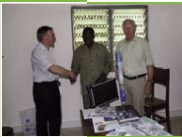
Übergabe des Klimakoffers in Kpalimé