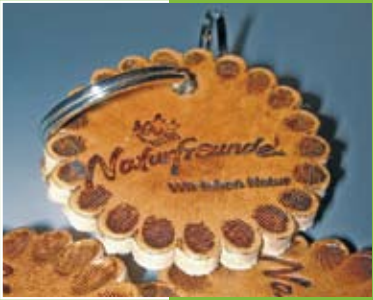
Schlüsselanhänger Key-ring pendant Porte-clé

DIE NATURFREUNDE Floridsdorf sind die mitgliederstärkste Ortsgruppe in Wien und legen traditionell großen Wert auf ihren gesellschaftlichen Beitrag zum politischen und sozialen Leben im Bezirk. Mit Lichtbildvorträgen von fernen Ländern und Kulturen