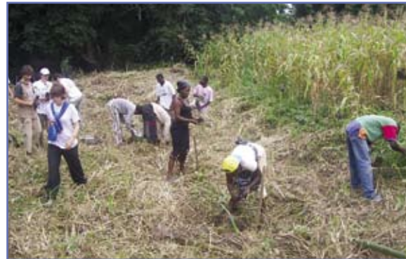
Workcamp Work camp Camp chantier

Quatre séries de camps chantiers ont été organisées pendant les mois d'été 2007, 2008, 2009 et 2010; un total d'environ 34000 arbres ont été plantés. À l'occasion des premiers camps chantiers en juin 2007 Case Togo a aménagé sa propre pépinière, dans laquelle une dizaine d'essences tropicales ont été mises en terre, dont certaines menacées de disparition. Les arbres plantés dans les années consécutives proviennent presque tous de la pépinière de Case Togo. L'entretien des espaces reboisés relève des populations villageoises, sous la tutelle de Case Togo.