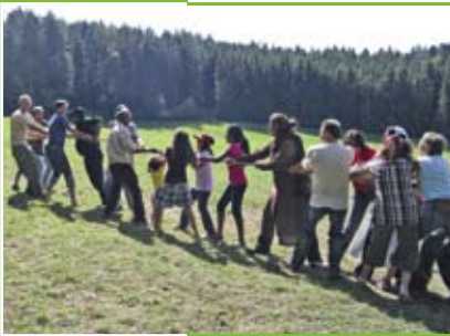
Beim Jahresausflug in Nördlingen